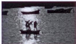
Palestrycy rybaczy ściągają sieci w porcie w Gazie.